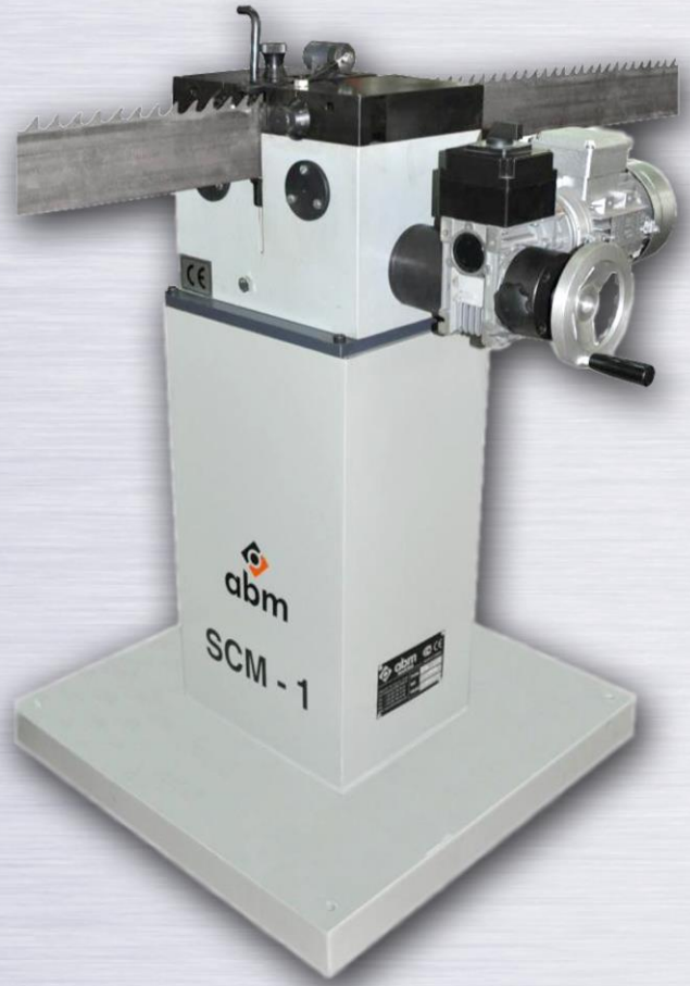
SCM-1 OTOMATİK ŞERİT TESTERE ÇAPRAZLAMA MAKİNASI