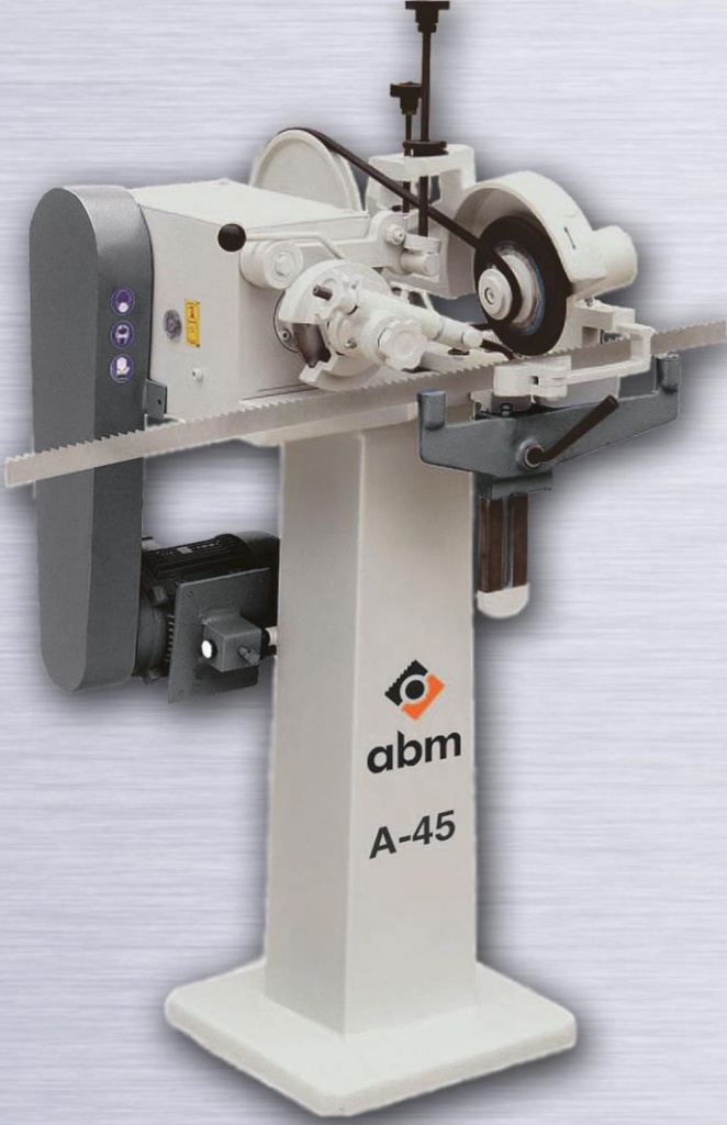
A-45 ŞERİT TESTERE BİLEME MAKİNASI