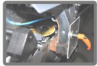
Otomatik Stellite Kesme Sistemi