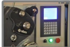
TFT Kontrol Paneli ile kullanım kolaylığı.

Mükemmel kesme yüzeyi kalitesi elde edilen, uzun ömürlü, minimum bileme süresi ile hassas patentli stellite uç kaynatma tekniği. (DİK KAYNATMA SİSTEMİ)