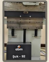
Motor yardımlı şerit testere aşağı-yukarı hareketi.