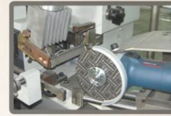
Kesme motoruyla manuel olarak kesilen stellite çubuk.