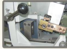
Manuel stellite uç kaynak, otomatik tavlama.

Aynı makinada hassas stellite uç kaynak ve tavlama sayesinde kusursuz kesim yüzeyi kalitesi sağlayan uzun ömürlü şerit testere.