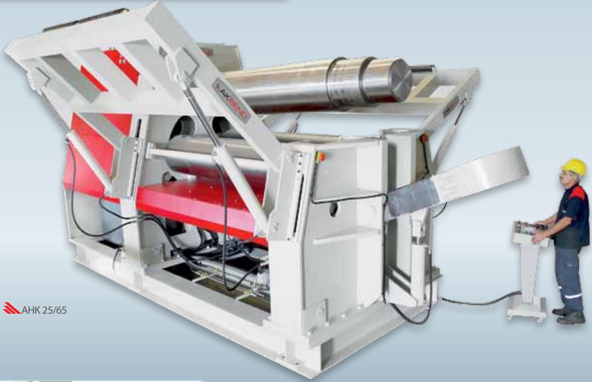
▲ AHK 25/65